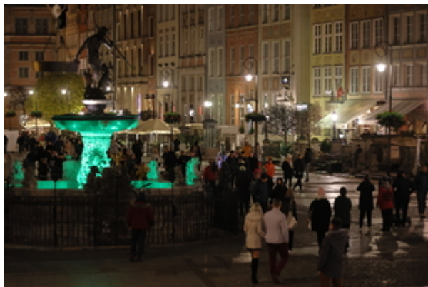
Obiekty gdańskie podświetlone na zielono.