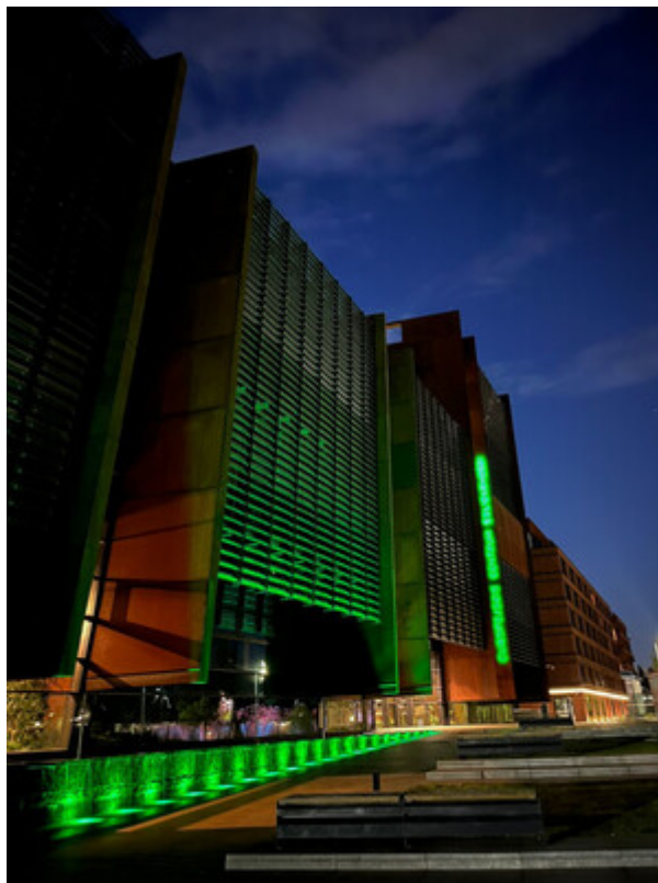
Fontanna przy ECS w Gdańsku.