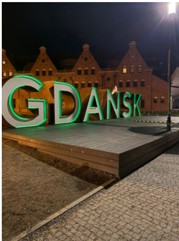
Napis Gdańsk na Ołowiance.