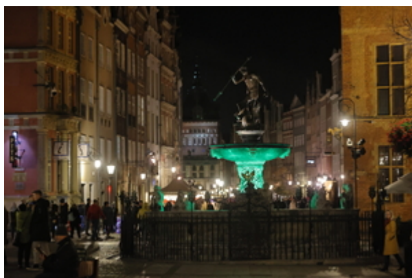
Obiekty gdańskie podświetlone na zielono.