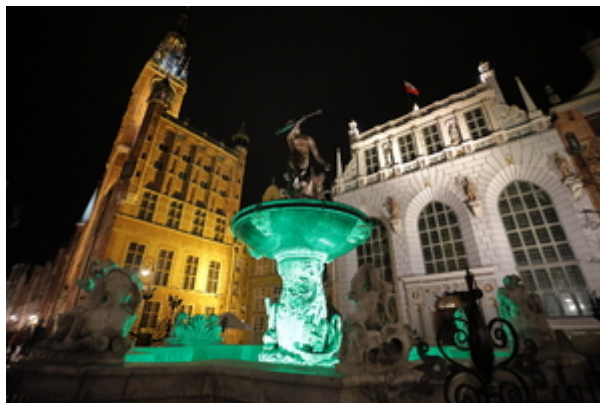
Obiekty gdańskie podświetlone na zielono.