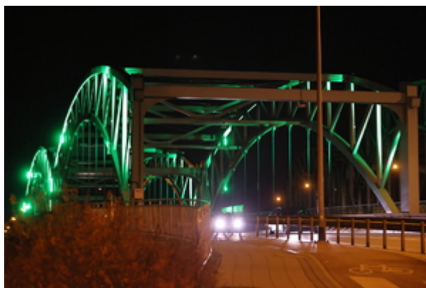
Obiekty gdańskie podświetlone na zielono.