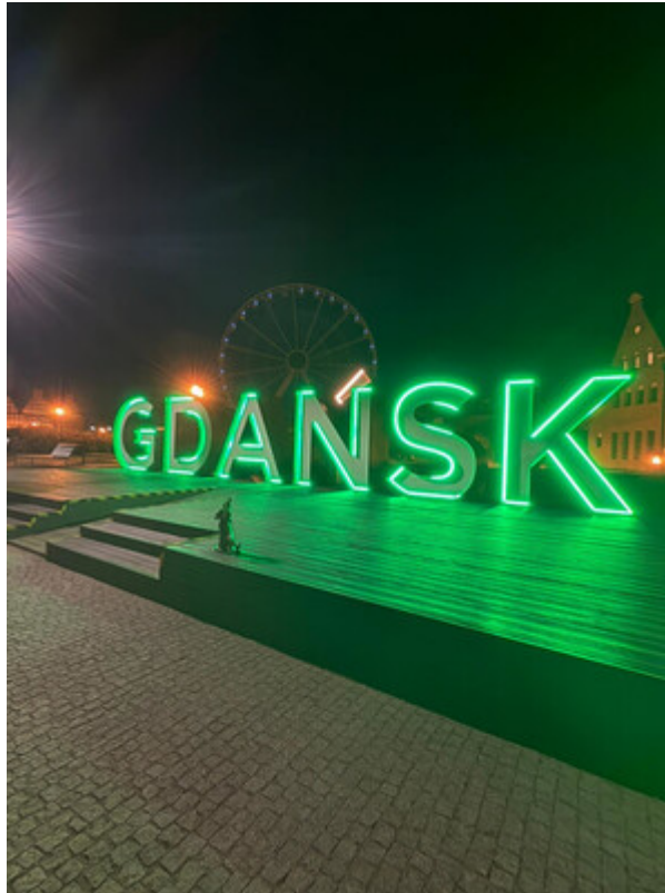
Napis Gdańsk na Ołowiance.