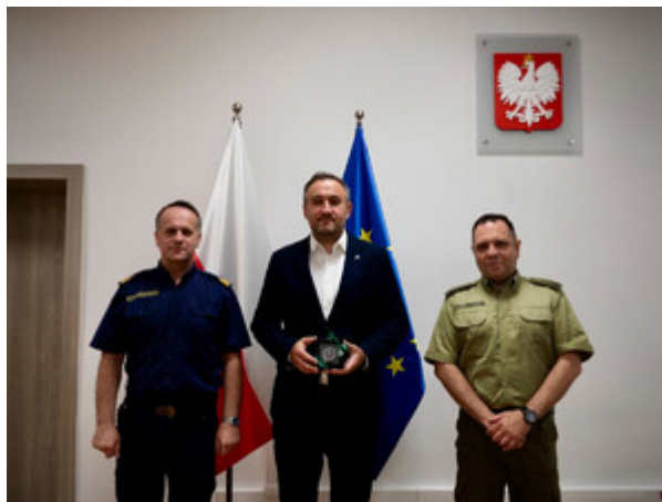
Wizyta Wiceprezydenta Gdyni w MOSG.