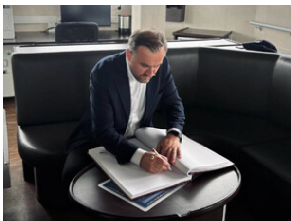
Wizyta Wiceprezydenta Gdyni w MOSG.