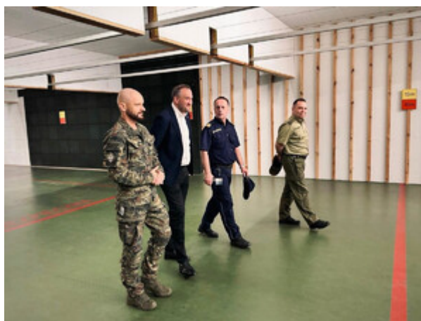
Wizyta Wiceprezydenta Gdyni w MOSG.