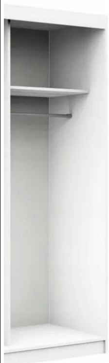
(zdjęcie poglądowe nr 1)

- Środkowa część szafy jak na zdjęciu poniżej ( składająca się z samych półek)