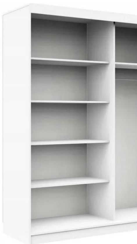
(zdjęcie poglądowe nr 2)

- Środkowa część szafy jak na zdjęciu poniżej ( składająca się z samych półek)