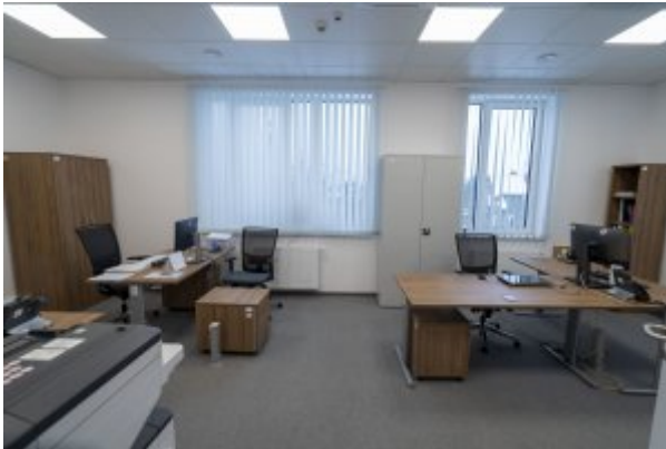
Fot. A. Kubiak