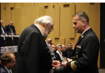
XV Konwent Morski w Gdańsku.