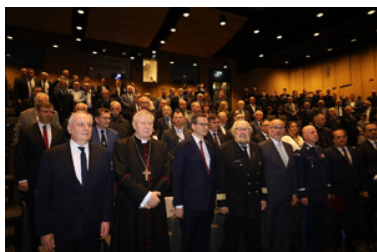
XV Konwent Morski w Gdańsku.