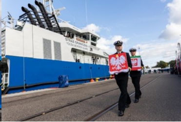
Pierwsze podniesienie bandery na nowej jednostce pływającej SG-301