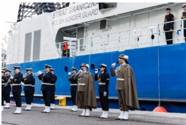
Pierwsze podniesienie bandery na nowej jednostce pływającej SG-301