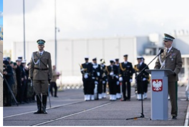
Pierwsze podniesienie bandery na nowej jednostce pływającej SG-301