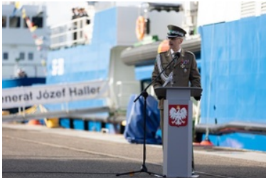
Pierwsze podniesienie bandery na nowej jednostce pływającej SG-301