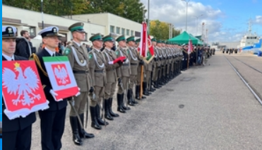
Pierwsze podniesienie bandery na nowej jednostce pływającej SG-301