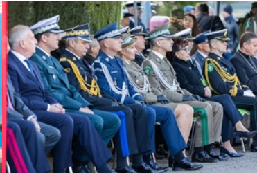
Pierwsze podniesienie bandery na nowej jednostce pływającej SG-301