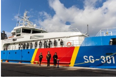
Pierwsze podniesienie bandery na nowej jednostce pływającej SG-301