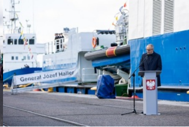
Pierwsze podniesienie bandery na nowej jednostce pływającej SG-301