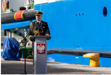
Pierwsze podniesienie bandery na nowej jednostce pływającej SG-301