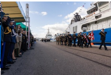
Pierwsze podniesienie bandery na nowej jednostce pływającej SG-301