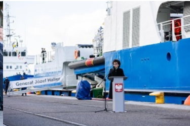
Pierwsze podniesienie bandery na nowej jednostce pływającej SG-301