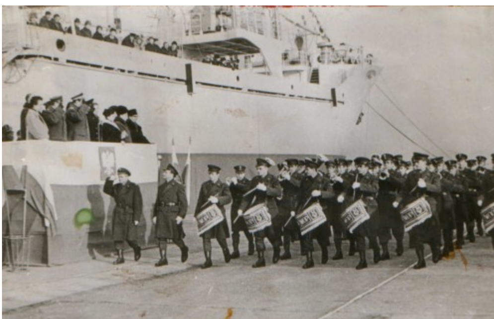
Orkiestra Kaszubskiej Brygady Wojsk Ochrony Pogranicza podczas nadania statkowi im. mjr H. Sucharskiego.

W 1979 roku orkiestra otrzymała wyróżnienie na Przeglądzie Orkiestr Wojskowych w Lubaniu.