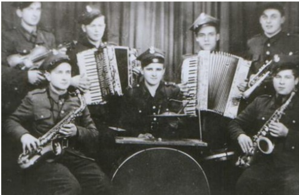
Zdjęcie zespołu będącego załążkiem Orkiestry Morskiego Oddziału Straży Granicznej, Gdańsk, 1949 r.